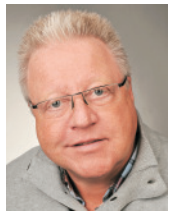
Thomas Clemens Vertriebsbüro Aachen