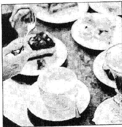
Die Lust auf Süßes kann auch zur Sucht werden

pharmakologische Wirkung der Droge verändert das Gehirn. Durcheinander gebracht werden vor allem die Transportwege des Botenstoffs Dopamin, der positiv besetzte Reize übermittelt. Durch regelmäßigen Drogenkonsum wird das Belohnungszentrum mit Dopamin regelrecht überflutet. Das führt zu zwei gegenläufigen Effekten. Zum einen wird die körpereigene Dopamin-Produktion gedrosselt. Normale Reize (Essen, Sex, Begegnungen) kitzeln das Hirn also immer weniger, dafür verlangt es mehr nach dem Drogenkick von außen. Zum anderen werden jene neuronalen Transportbahnen, die mit dem Drogenreiz zusammenhängen, bei häufiger Benutzung verstärkt. So erhöht sich die Zahl jener Schaltstellen, die Dopamin-Signale empfangen können.